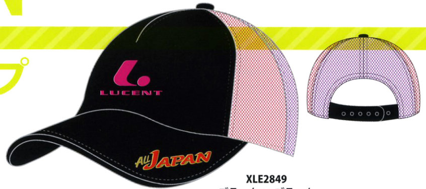
XLE2849 ブラック × ブラック