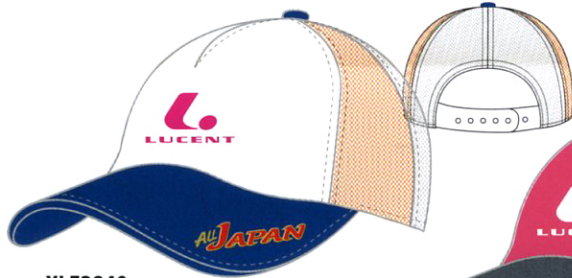
XLE2840 ホワイト × ネイビー