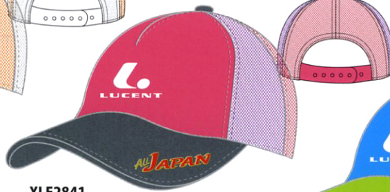
XLE2841 ピンク × チャコール